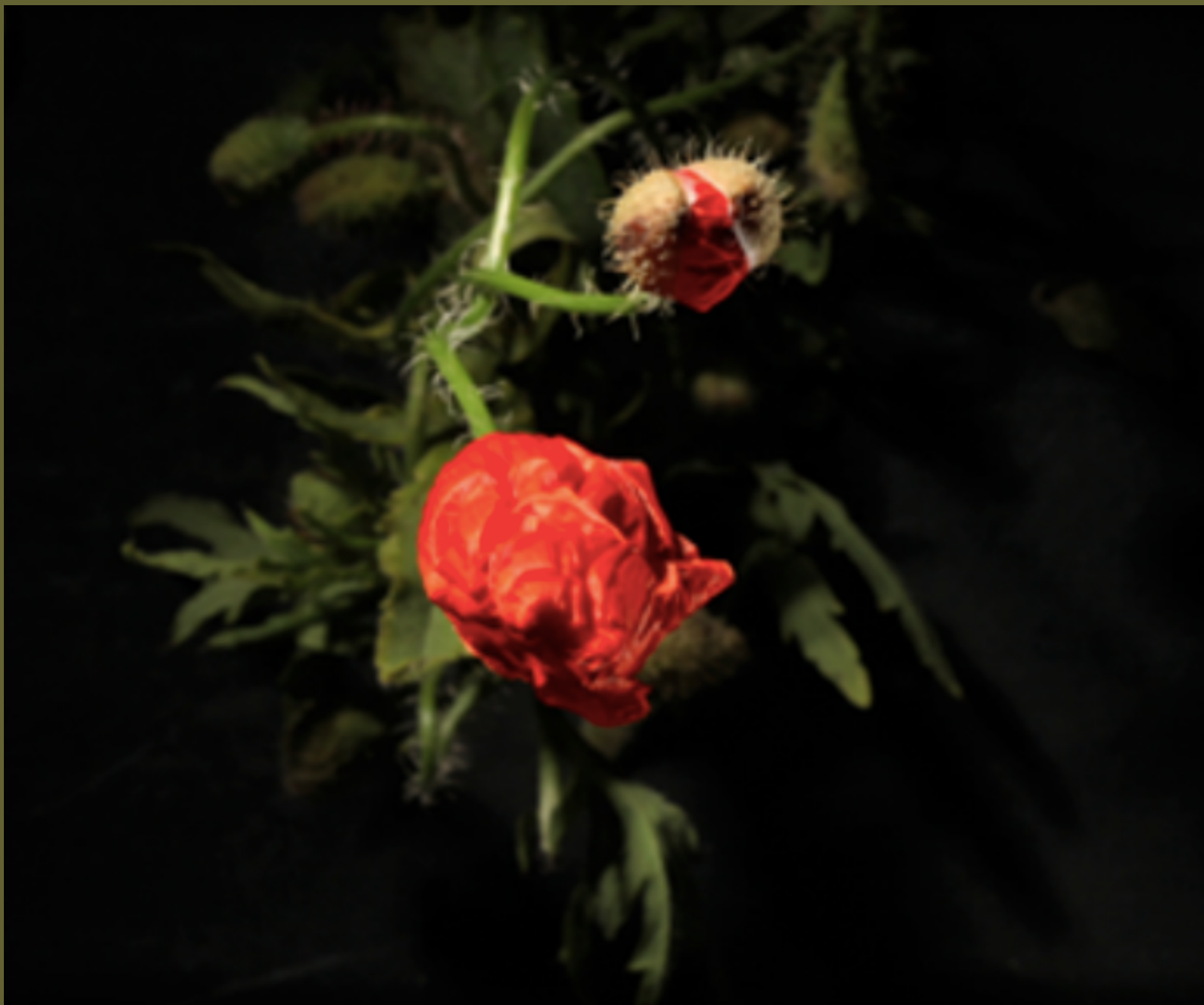
Still fra værket Red Poppies (2016)